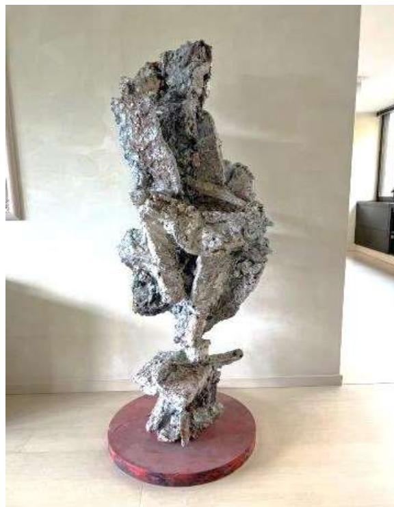
8) Scultura, 2002. Tecnica mista su resina, h. cm. 200. N. inv. 03090019/1, ingresso al primo piano.