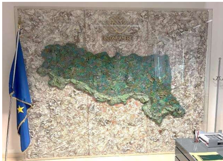
7) Carta geografica dell'Emilia Romagna, 2004. Tecnica mista su pannello in legno, cm. 250 x 280. N. inv. 03090029, sala presidenza al primo piano.