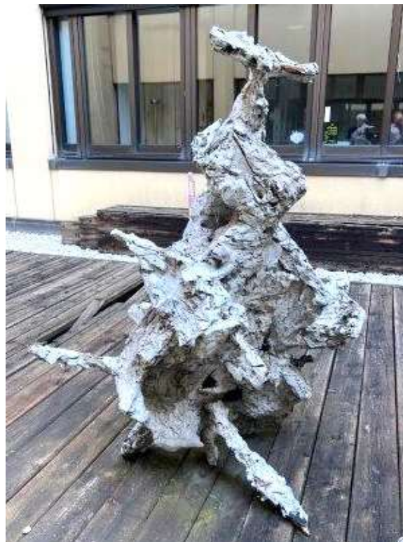
10) Scultura, 2002. Tecnica mista su resina, h. cm. 140. N. inv. 03090019/3, cavedio al primo piano.