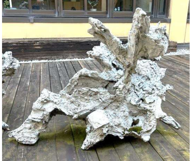
9) Scultura, 2002. Tecnica mista su resina, h. cm. 107. N. inv. 03090019/2, cavedio al primo piano.