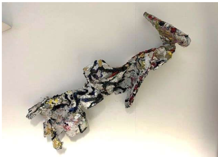
6) Scultura, 2002. Tecnica mista su volume in resina, cm. 45 x 100. N. inv. 03090020/5, corridoio al primo piano.