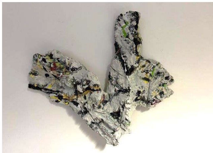
5) Scultura, 2002. Tecnica mista su volume in resina, cm. 55 x 60. N. inv. 03090020/4, corridoio al primo piano.