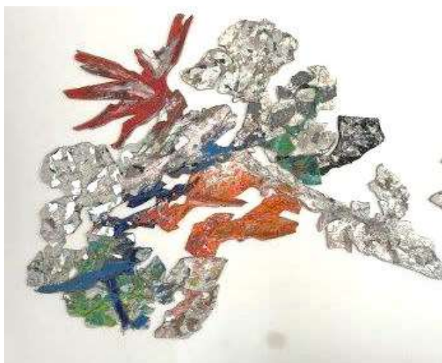
12) Opera sagomata, 2002. Tecnica mista su pannello in legno, cm. 160 x 200. N. inv. 03090017/2, ufficio del Segretario Generale al primo piano.