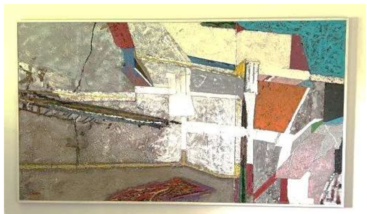
14) Grande pannello, 2002. Tecnica mista su tela, cm. 140 x 240. N. inv. 03090016, Sala Verdi al primo piano.