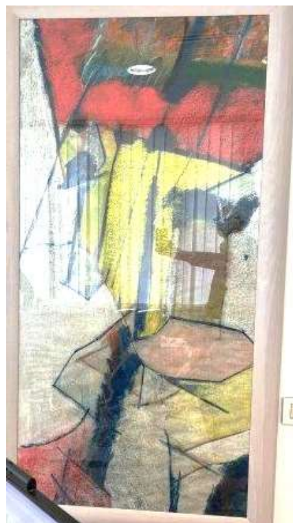
11) Disegno, 2002. Gessetto su carta, cm. 150 x 70. N. inv. 03090018, ufficio segreteria al primo piano.