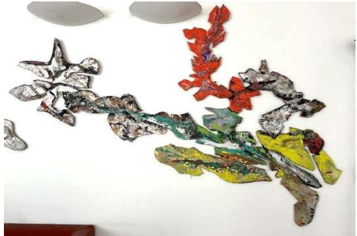
13) Opera sagomata, 2002. Tecnica mista su pannello in legno, cm. 150 x 220. N. inv. 03090017/3, ufficio del Segretario Generale al primo piano.