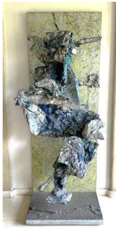
15) Scultura, 2002. Tecnica mista su volume in resina, h. cm. 190. N. inv. 03090019/4, ingresso al piano terra.