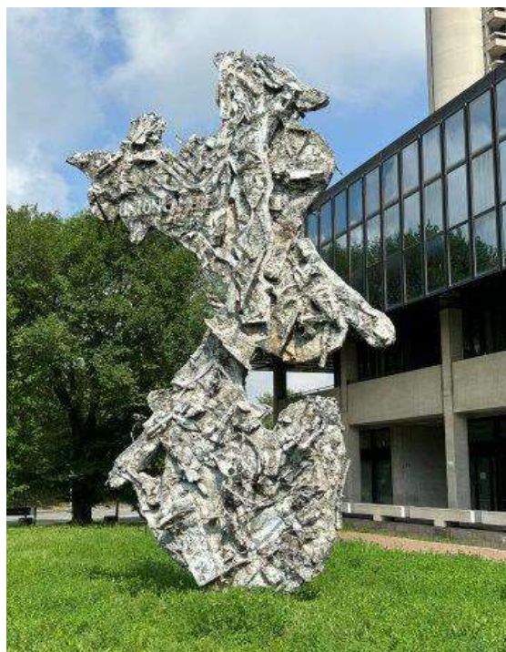
16) Scultura, 2006. Volume in resina, h. cm. 700 circa. N. inv. 03090032, giardino al piano terra.