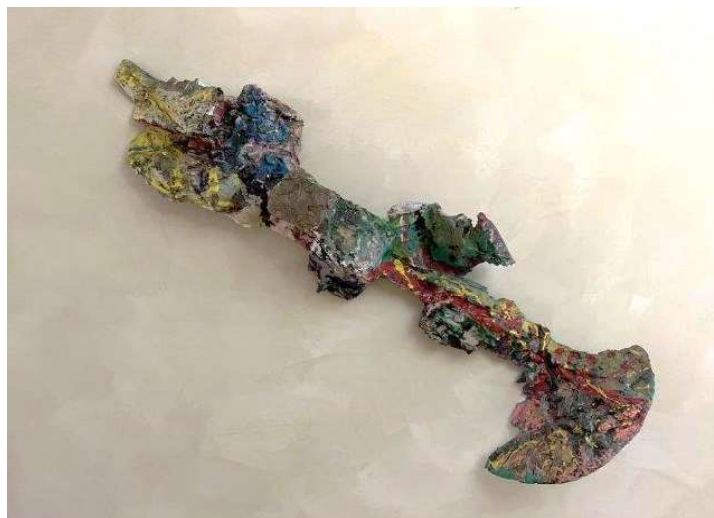
3) Scultura, 2002. Tecnica mista su volume in resina, cm. 42 x 127. N. inv. 030090020/2, corridoio al primo piano.