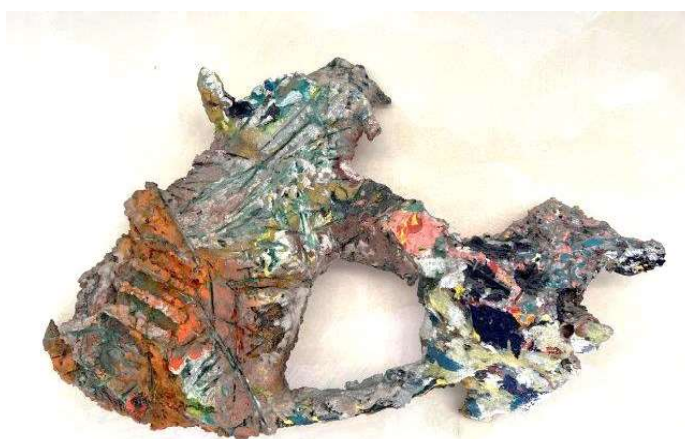
4) Scultura, 2002. Tecnica mista su volume in resina, cm. 52 x 85. N. inv. 03090020/3, corridoio al primo piano.